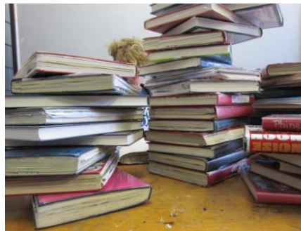
Ckv docent kijkt ckv kunstdossiers na.

De ruggengraat van het vak CKV was het bijhouden van een persoonlijk dossier van bezochte theater- of dansvoorstellingen naar keuze. Minister Van Bijsterveldt (Onderwijs) vindt dat dit systeem gemakzucht bij de docenten in de hand werkt. Ze verwacht dat scho- Volkskrant, 5-10-2012.