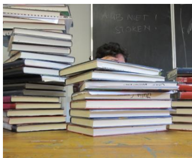
Ckv docent kijkt ckv kunstdossiers na.