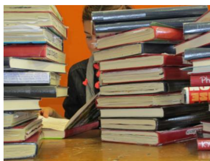
Ckv docent kijkt ckv kunstdossiers na.