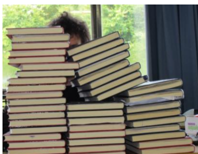
CKV docent kijkt ckv kunstdossiers na.