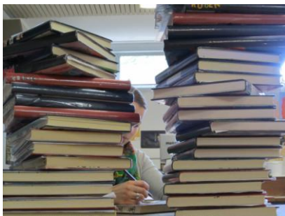
Ckv docent kijkt ckv kunstdossiers na.